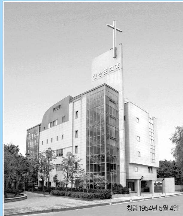
창립 1954년 5월 4일